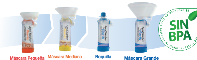
Máscara Pequeña Máscara Mediana Boquilla Máscara Grande